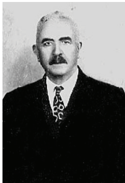
Figura 01: Luis Francescon

A Congregação Cristã do Brasil, como era denominada nos seus primórdios e, após sua expansão, Congregação Cristã no Brasil (CCB), surge com e sob a liderança de Luis Francescon, um italiano emigrado para os Estados Unidos. “Ao longo da sua vida, Francescon manteve contato com os “movimentos de santidade” que irromperam nos Estados Unidos, no início do século XX e participou dos primórdios do pentecostalismo naquele país” (Yara MONTEIRO, 2010, p. 127).